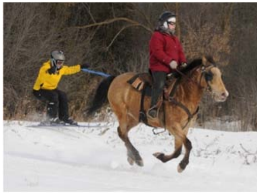
Ski attelé

En Suisse, une piste de luge de six kilomètres entièrement éclairée et composée de nombreux virages relie deux communes, Preda et Bergün, d'où son nom: la piste de luge Preda-Bergün. Pour remonter la piste, les lugeurs prennent le train!