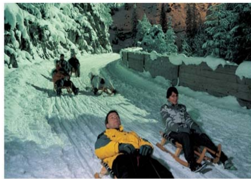
Piste de luge éclairée de Preda-Bergün

En Suisse, une piste de luge de six kilomètres entièrement éclairée et composée de nombreux virages relie deux communes, Preda et Bergün, d'où son nom: la piste de luge Preda-Bergün. Pour remonter la piste, les lugeurs prennent le train!