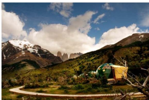
EcoCamp Patagonia – Torres del Paine, Chile

Les technologies vertes sont à l'honneur dans le domaine EcoCamp Patagonia situé au Chili. Ce centre de plein air de la Patagonie exploité par Cascada Expediciones fonctionne avec de l'énergie 100% renouvelable et est conçu spécialement pour permettre au visiteur de vivre une expérience grande nature tout en minimisant son impact sur celle-ci. L'hébergement consiste en une série de dômes, inspirés des habitations des peuples autochtones de l'endroit, qui, par leur forme arrondie et leur couleur verte, s'harmonise bien avec le paysage environnant. L'hydroélectricité et l'énergie solaire sont utilisées pour le chauffage et l'éclairage. La toilette fonctionne avec un système de traitement et de compostage plutôt sophistiqué. Les visiteurs sont aussi bien sensibilisés à se conformer aux politiques de l'organisation quant à la gestion des déchets lors de leur séjour ainsi que de leurs randonnées dans la région. Certifié ISO 14001, l'entreprise s'est vue décorée de plusieurs distinctions pro-environnementales.